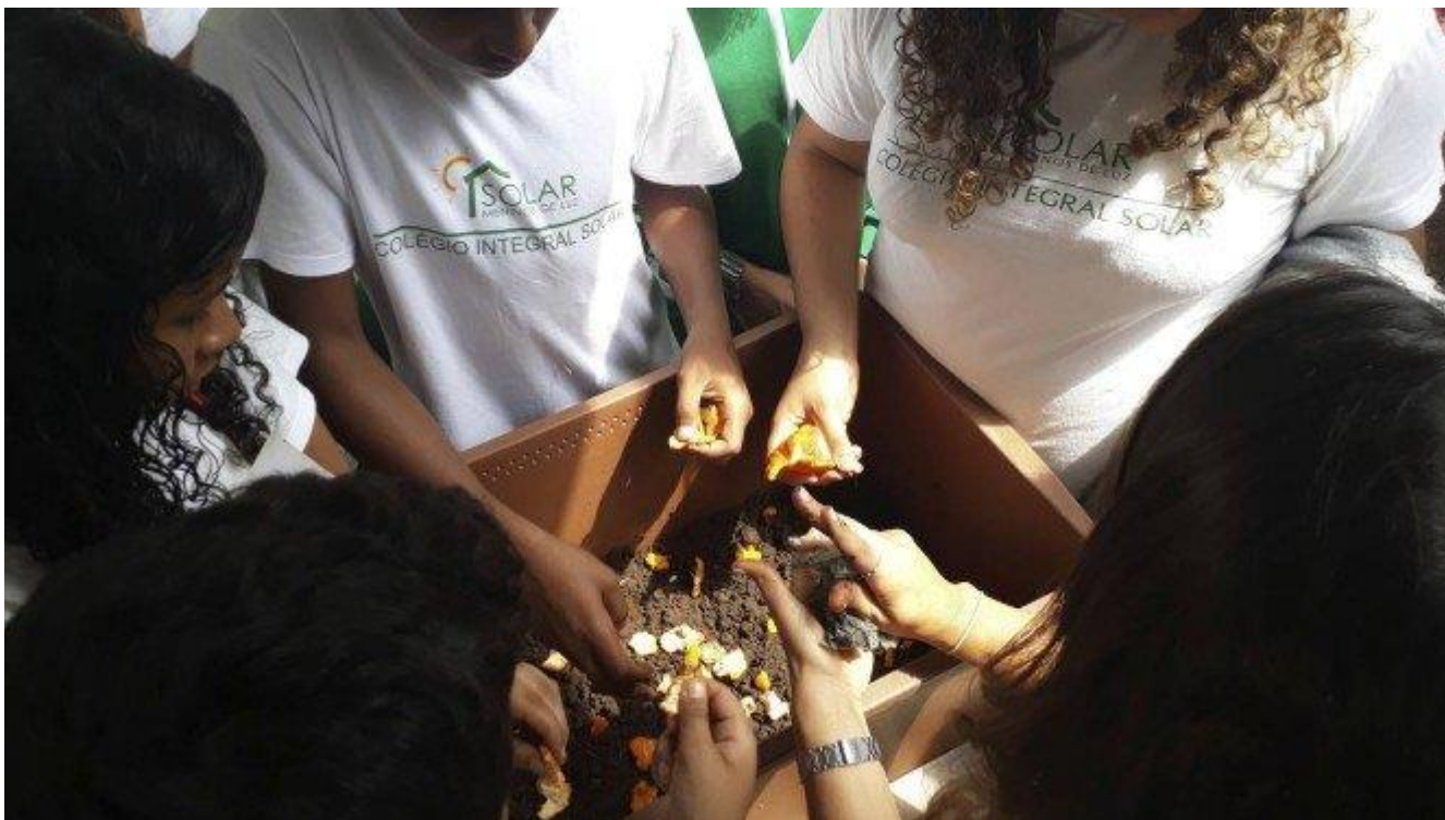
Juntas, crianças do Colégio Integral Solar aprendem noções sobre lixo e compostagem

Paulo Freire também defendia a escola em tempo integral. No Solar, a carga horária diária é de 10h. Além das aulas, os estudantes podem escolher entre 50 atividades extracurriculares, como oficinas de música, dança, inglês e informática. Manter os jovens mais horas no colégio é uma forma de mostrar a eles que o caminho da educação pode melhorar sua condição de vida, ao mesmo tempo que os afasta da criminalidade. É nisso que Isabella acredita.